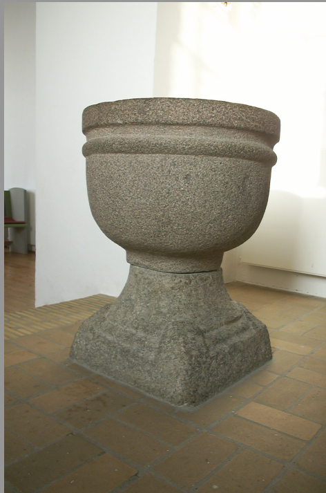
Døbefont fra 1100 tallet