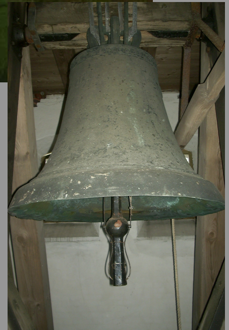
Den ældste kirkeklokke fra 1504